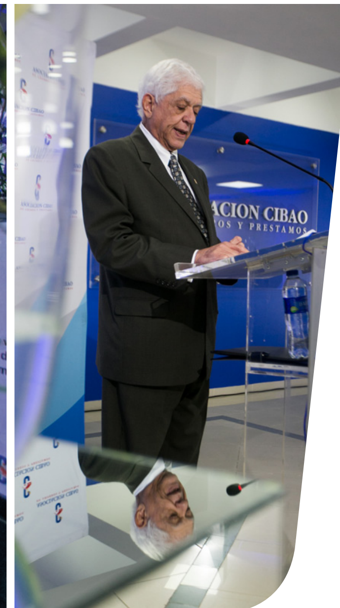
Asamblea general ordinaria anual de asociados celebrada el 23 de marzo de 2018.